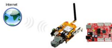
เชื่อมต่อ Network ผ่านเครือข่าย สัญญาณโทรศัพท์มือถือ