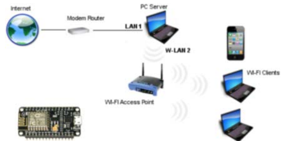
เชื่อมต่อ Network ผ่านสัญญาณ WIFI